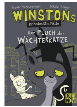
Winstons geheimste Falle (Band 1) - Der Fluch der Wachterkatze