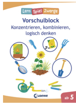
Die neuen LernSpielZwerge - Konzentrieren, kombinieren, logisch denken