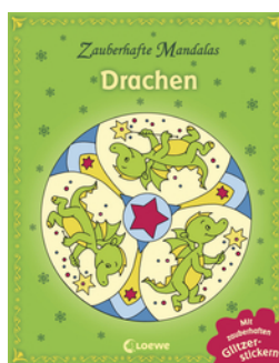
Zauberhafte Mandalas: Drachen (mit Glitzerstickern)