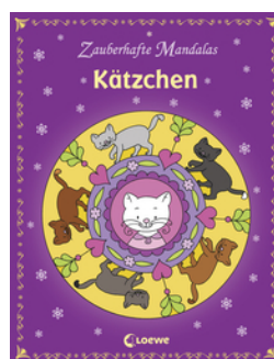
Zauberhafte Mandalas - Kätzchen