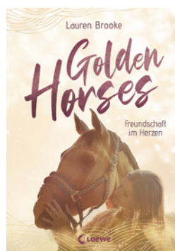
Golden Horses (Band 3) - Freundschaft im Herzen