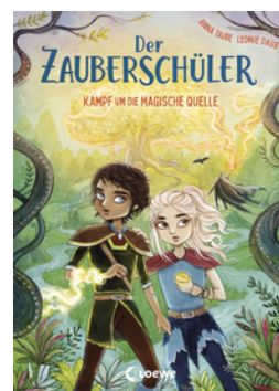
Der Zauberschüler (Band 4) - Kampf um die Magische Quelle