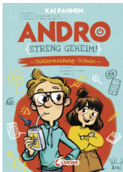
Andro, streng geheim! (Band 1) - Fehlermeldung: Schule