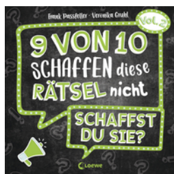
9 von 10 schaffen diese Rätsel nicht - schaffst du sie? - Vol. 2