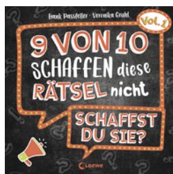
9 von 10 schaffen diese Rätsel nicht - schaffst du sie? - Vol. 1