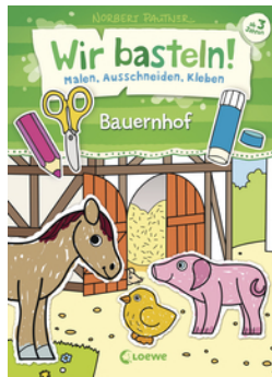
Wir basteln! - Malen, Ausschneiden, Kleben - Bauernhof