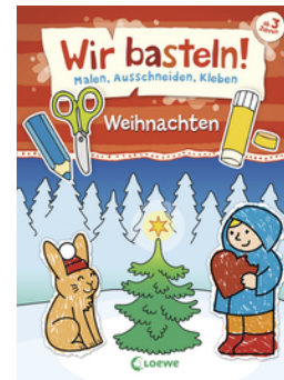
Wir basteln! - Malen, Ausschneiden, Kleben - Weihnachten