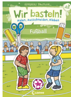
Wir basteln! - Malen, Ausschneiden, Kleben - Fußball