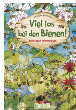
Viel los bei den Bienen!