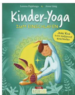
Kinder-Yoga zum Einschlafen