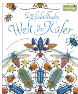
Die fabelhafte Welt der Käfer