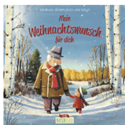
Mein Weihnachtswunsch für dich