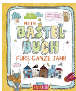
Mein Bastelbuch fürs ganze Jahr