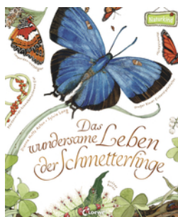
Das wundersame Leben der Schmetterlinge