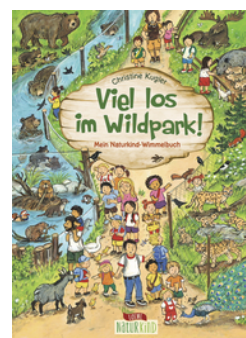
Viel los im Wildpark!