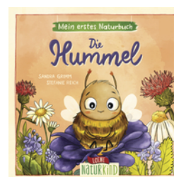
Mein erstes Naturbuch - Die Hummel