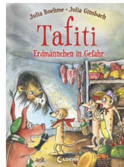
Tafiti (Band 23) - Erdmännchen in Gefahr