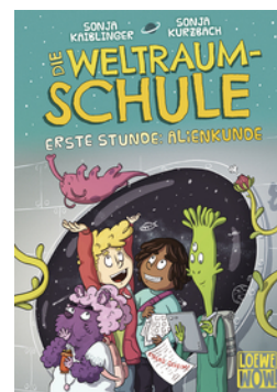
Die Weltraumschule (Band 1) - Erste Stunde: Alienkunde