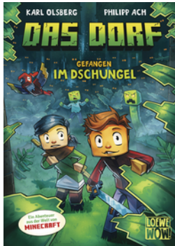
Das Dorf (Band 3) - Gefangen im Dschungel