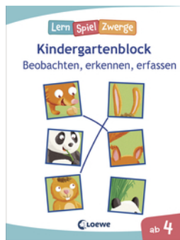
Die neuen LernSpielZwerge - Beobachten, erkennen, erfassen