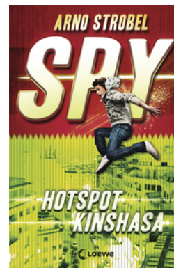
SPY (Band 2) - Hotspot Kinshasa