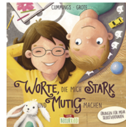
Worte, die mich stark und mutig machen