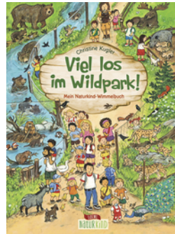
Viel los im Wildpark!