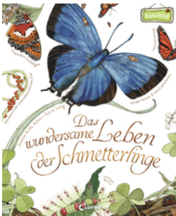
Das wundersame Leben der Schmetterlinge