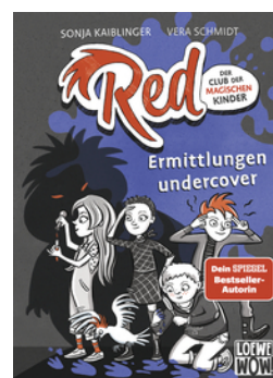
Red - Der Club der magischen Kinder (Band 2) - Ermittlungen undercover