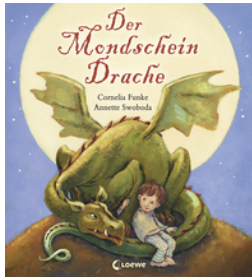
Der Mondschein- drache