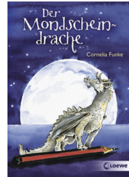
Der Mondschein- drache

... und 37 weitere Titel des Autors vorhanden.