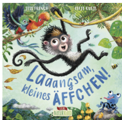
Laaangsam, kleines Äffchen!