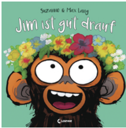
Jim ist gut drauf