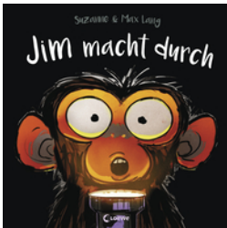
Jim macht durch