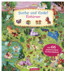
Suche und finde! Einhörner