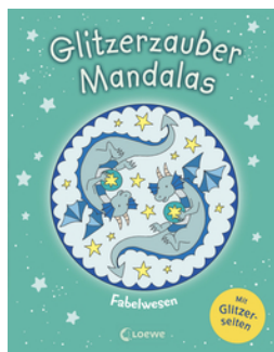
Glitzerzauber-Mandalas - Fabelwesen