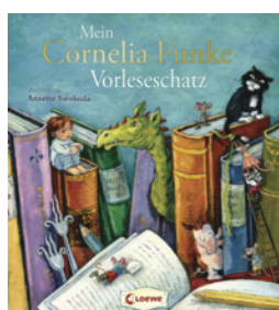
Mein Cornelia-Funke- Vorleschatz