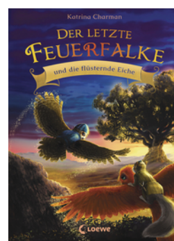
Der letzte Feuerfalke und die flüsternde Eiche (Band 3)