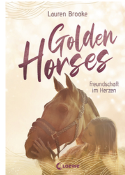
Golden Horses (Band 3) - Freundschaft im Herzen