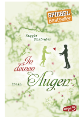
In deinen Augen