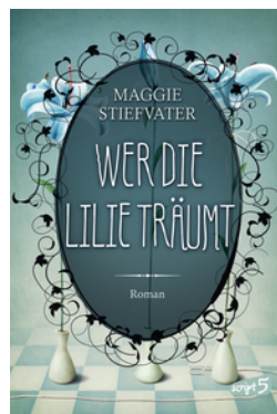
Wer die Lilie träumt (Band 2)