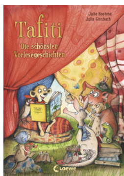
Tafiti - Die schönsten Vorlesegeschichten