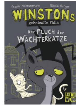
Winstons geheimste Fälle (Band 1) - Der Fluch der Wächterkatze