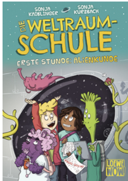
Die Weltraumschule (Band 1) - Erste Stunde: Alienkunde