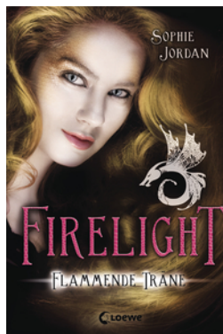
Firelight (Band 2) – Flammende Träne