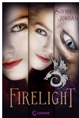
Firelight – Die komplette Trilogie