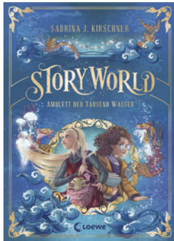
StoryWorld (Band 1) - Amulett der Tausend Wasser