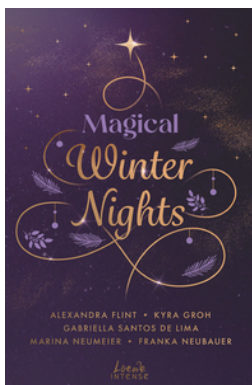
Magical Winter Nights