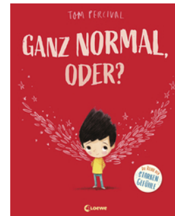
Ganz normal, oder? (Die Reihe der starken Gefühle)