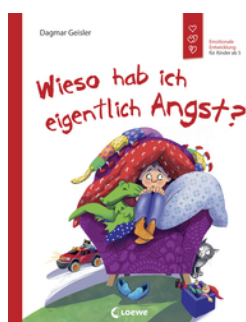
Wieso hab ich eigentlich Angst? (Starke Kinder, glückliche Eltern)