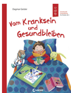
Vom Kranksein und Gesundbleiben (Starke Kinder, glückliche Eltern)