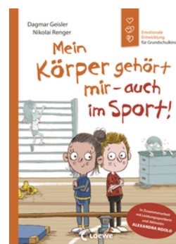
Mein Körper gehört mir - auch im Sport! (Starke Kinder, glückliche Eltern)