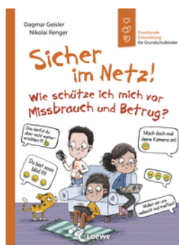
Sicher im Netz! Wie schütze ich mich vor Missbrauch und Betrug? (Starke Kinder, glückliche Eltern)