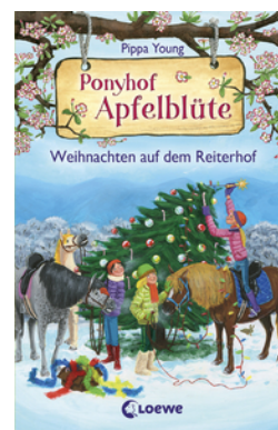
Ponyhof Apfelblüte - Weihnachten auf dem Reiterhof