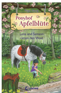
Ponyhof Apfelblüte (Band 22) - Lena und Samson retten den Wald