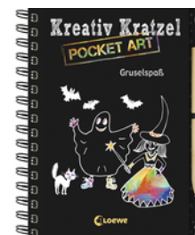
Kreativ-Kratzel Pocket Art: Gruselspaß