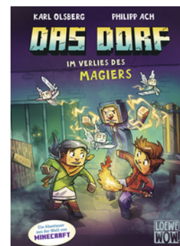
Das Dorf (Band 7) - Im Verlies des Magiers