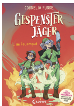
Gespensterjäger im Feuertopk (Band 2) - Mit 8 neu illustrierten Farbseiten