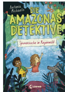
Die Amazonas-Detektive (Band 3) - Spurensuche im Regenwald