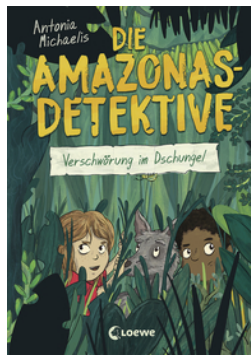
Die Amazonas-Detektive (Band 1) - Verschwörung im Dschungel