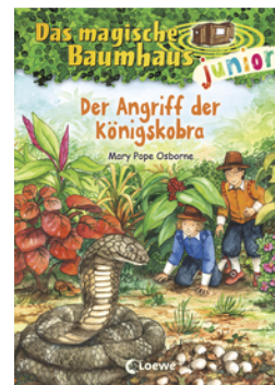
Das magische Baumhaus junior (Band 39) - Der Angriff der Königskobra