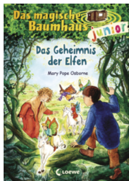
Das magische Baumhaus junior (Band 38) - Das Geheimnis der Elfen