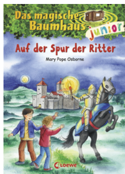
Das magische Baumhaus junior (Band 2) - Auf der Spur der Ritter