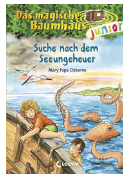
Das magische Baumhaus junior (Band 36) - Suche nach dem Seeungeheuer