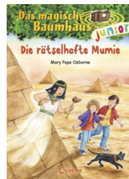
Das magische Baumhaus junior (Band 3) - Die rätselhafte Mumie