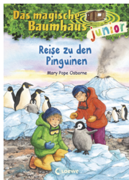
Das magische Baumhaus junior (Band 37) - Reise zu den Pinguinen