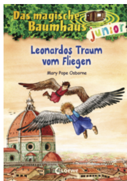
Das magische Baumhaus junior (Band 35) - Leonardos Traum vom Fliegen