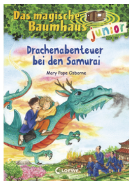
Das magische Baumhaus junior (Band 34) - Drachenabenteuer bei den Samurai