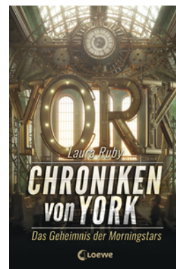
Chroniken von York (Band 2) - Das Geheimnis der Morningstars