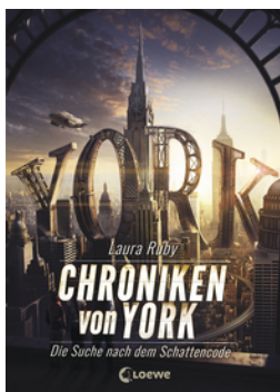
Chroniken von York (Band 1) - Die Suche nach dem Schattencode