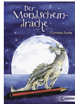
Der Mondschein- drache

... und 37 weitere Titel des Autors vorhanden.