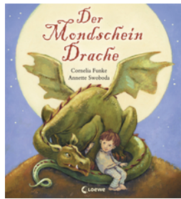
Der Mondschein- drache