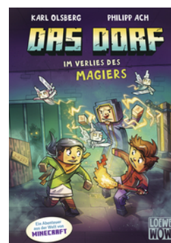
Das Dorf (Band 7) - Im Verlies des Magiers