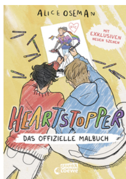
Heartstopper - Das offizielle Malbuch