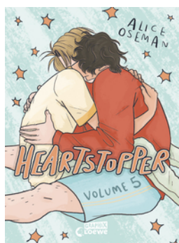
Heartstopper Volume 5 (deutsche Hardcover-Ausgabe)