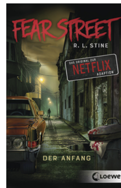
Fear Street - Der Anfang