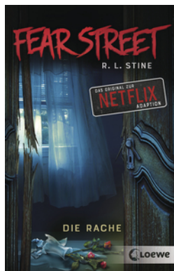
Fear Street - Die Rache