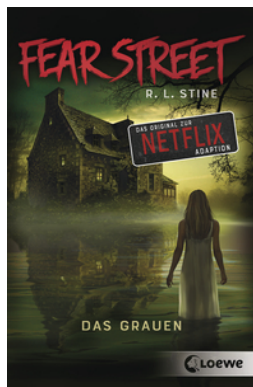
Fear Street - Das Grauen