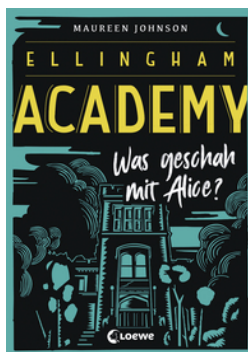
Ellingham Academy (Band 1) - Was geschah mit Alice?