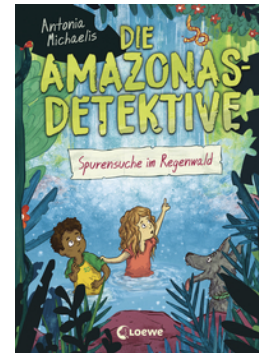
Die Amazonas-Detektive (Band 3) - Spurensuche im Regenwald