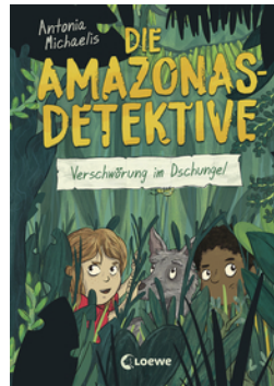
Die Amazonas-Detektive (Band 1) - Verschwörung im Dschungel