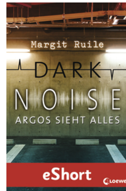
Dark Noise - Argos sieht alles