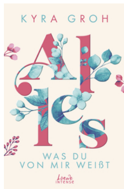
Alles, was du von mir weißt (Alles-Trilogie, Band 2)