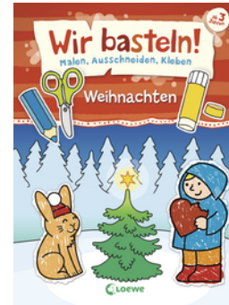
Wir basteln! - Malen, Ausschneiden, Kleben - Weihnachten