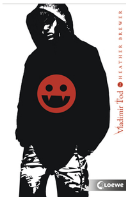
Vladimir Tod hat Blut geleckt (Band 1)