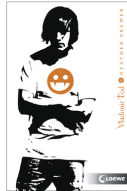
Vladimir Tod kämpft verbissen (Band 4)