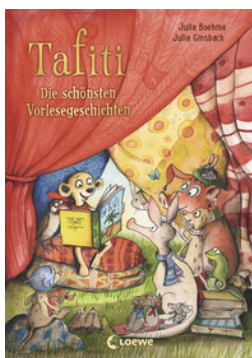
Tafiti - Die schönsten Vorlesegeschichten