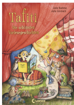
Tafiti - Die schönsten Vorlesegeschichten